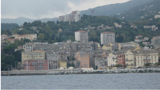
La ville de Bastia

Ciel nuageux, vent quasi nul force 1. En cours de route, le ciel ne se dégage pas et le vent se maintient force 1 avec rafales à 0.