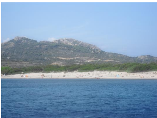
Au sud de Rondinara

Je me rallonge quand même -pour le nettoyage on verra plus tard- et c'est au tour de Sylvie de rendre son petit déjeuner dans un sac poubelle. Puis c'est au tour d'Angel de venir s'allonger pour fuir la froidure des éléments.