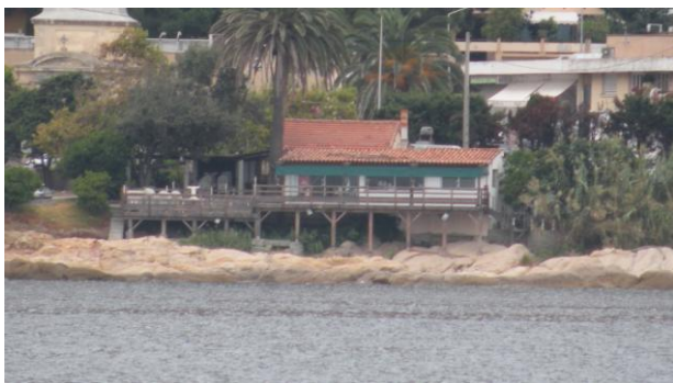
La maison de Tino Rossi

l'occasion de faire des calculs de consommation. Du départ d'Ajaccio à Bastia par le sud, nous avons consommé 3 fois plus de gasoil que de Bastia à Ajaccio par le nord. Pourtant la distance est similaire (157 milles contre 142 milles), nous avons utilisé le moteur à peu près