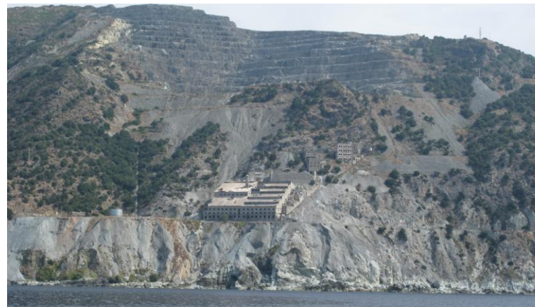
La mine d'amiante de Canari

Au cours de cette même descente, nous passons devant la mine d'amiante de Canari. Il n'y a pas que l'amiante qui ait fait des dégâts sur la côte : l'exploitation de la roche dite « vert de Corse », bien qu'à une plus faible échelle, a elle aussi bien entamé la montagne. Dommage pour le cap !