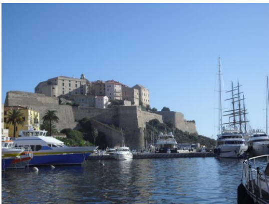
La citadelle vue du port