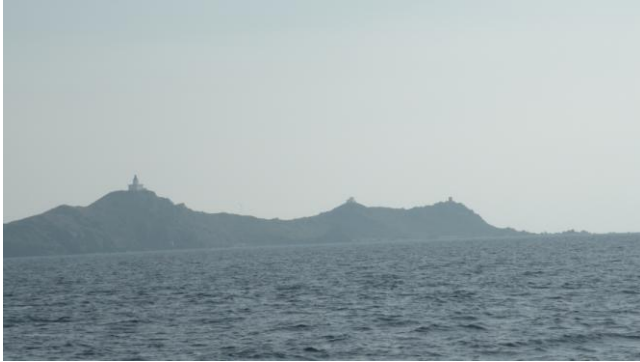
Les îles sanguinaires

A 14h45, notre vitesse chutant proportionnellement à celle du vent qui vient de passer force 2, nous enroulons le foc et relançons le moteur. 1/2h sans le moteur, c'est toujours ça de gagné sur nos 14 jours de navigation.