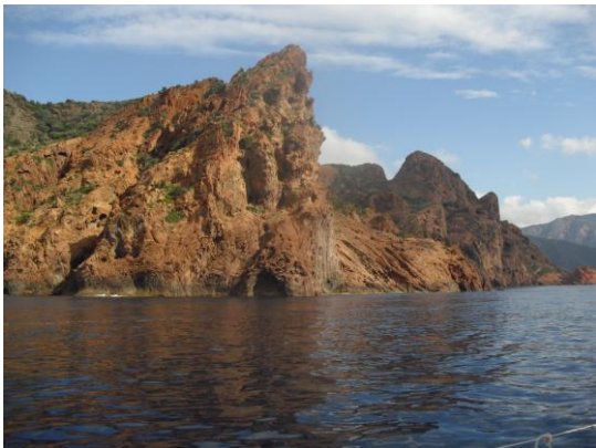
Les falaises de Girolata

Le carré se réveille à 7h30. Sylvie n'a pas dormi de la nuit à cause du léger clapot qui agitait le bateau et battait sur la jupe arrière.