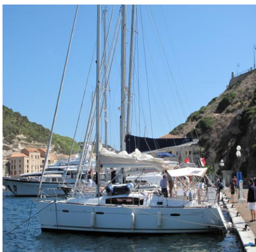
Malava IV à quai à Bonifacio

Vols Rennes → Ajaccio via Nice sans histoire si ce n'est que je débarque à Ajaccio avec seulement 1 café, 3 galettes bretonnes et 1 jus d'orange dans le ventre. Pour une arrivée à 15h15 avec un petit déjeuner pris à 6h30, c'est plutôt léger ! Mes coéquipiers ont subi le même traitement sur leur vol en provenance de Lesquin. Avant de rejoindre la marina Charles Ornano (ancien maire d'Ajaccio), je m'offre un jambon-beurre pour calmer la faim qui me tenaille.