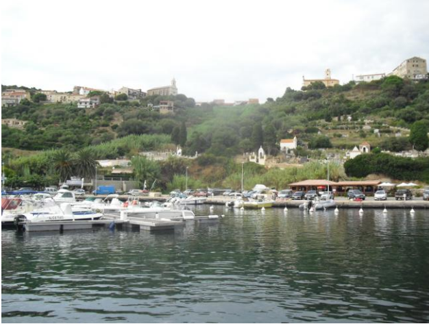
Le port et la ville de Cargèse

profondeur qui risque d'être insuffisante pour le passage de notre safran. Cette solution prudente ne facilite évidemment pas notre descente sur le quai !